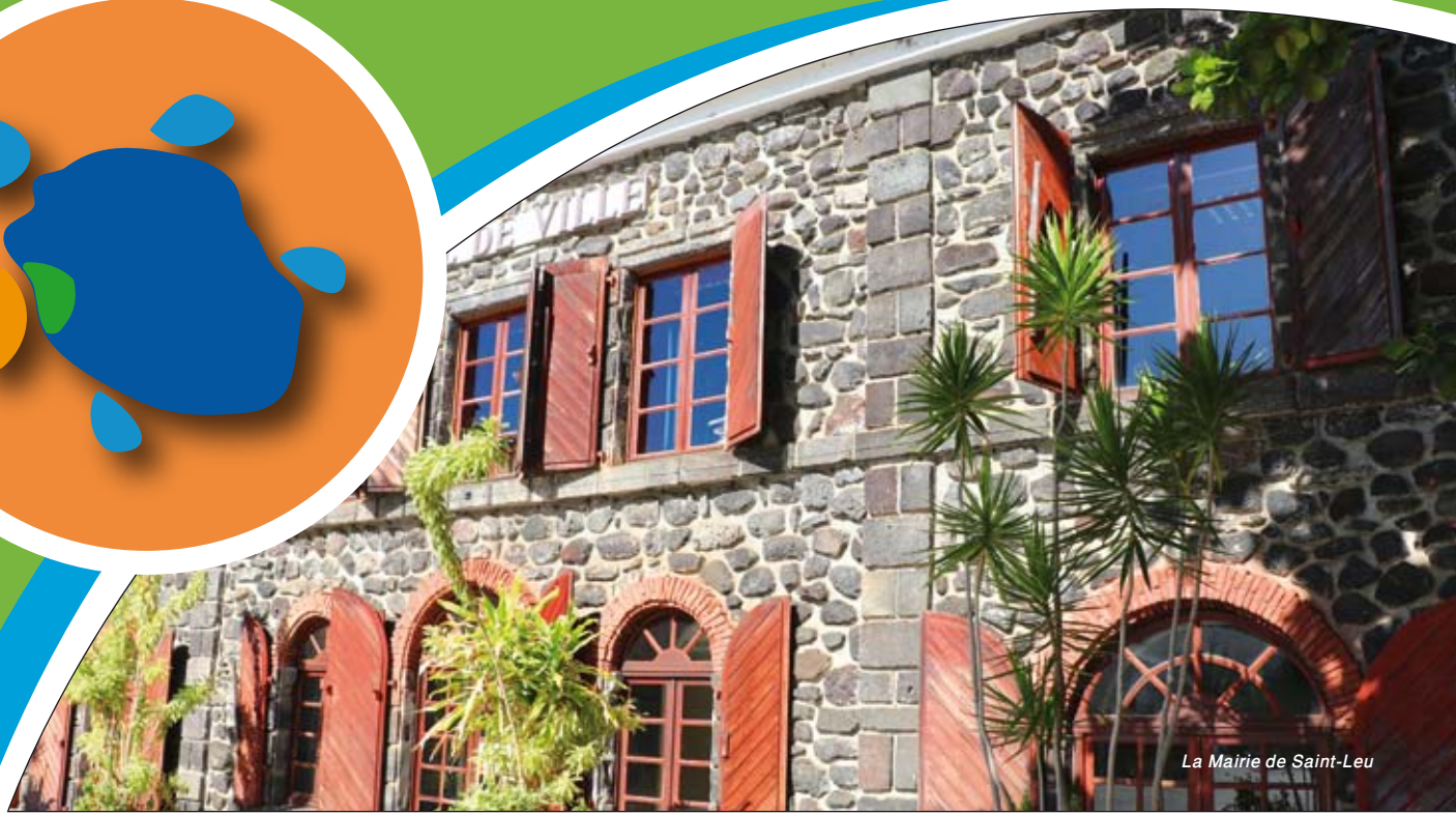
La Mairie de Saint-Leu